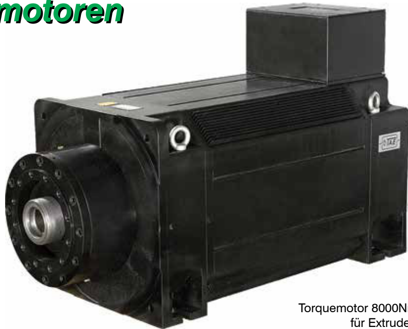
Torquemotor 8000Nm mit Drucklager für Extruderanbau