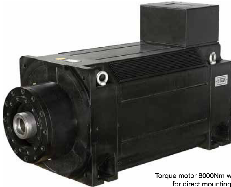
Torque motor 8000Nm with thrust bearing for direct mounting of extruder